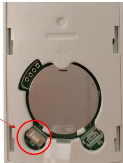
Télécommandes Pour volets roulants achetés avant le 01/11/2022