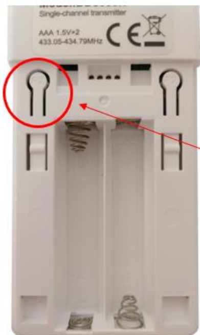
Télécommandes Pour volets roulants achetés après le 01/11/2022